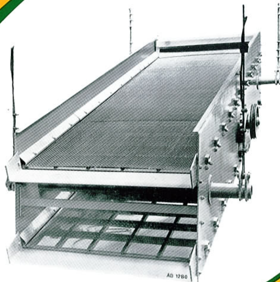
Fig. 1 Crible V 2 M 175 x 400